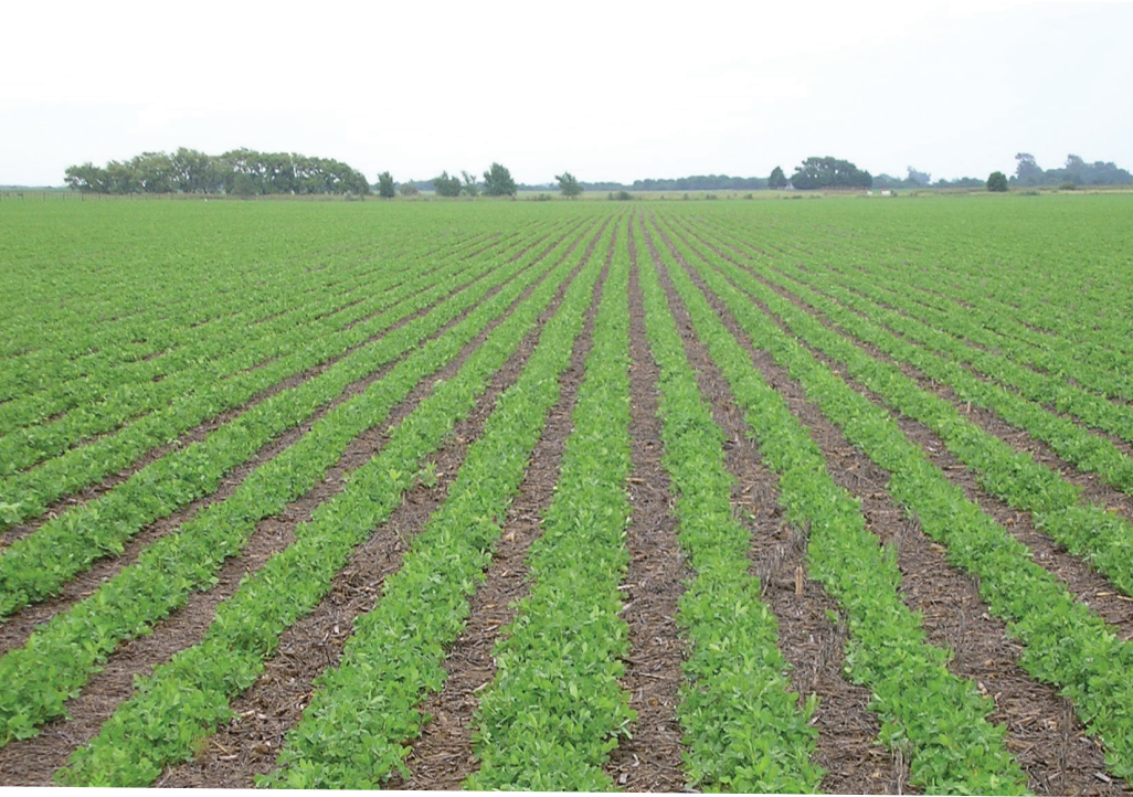
Cultivo de maní sobre rastrojo de soja