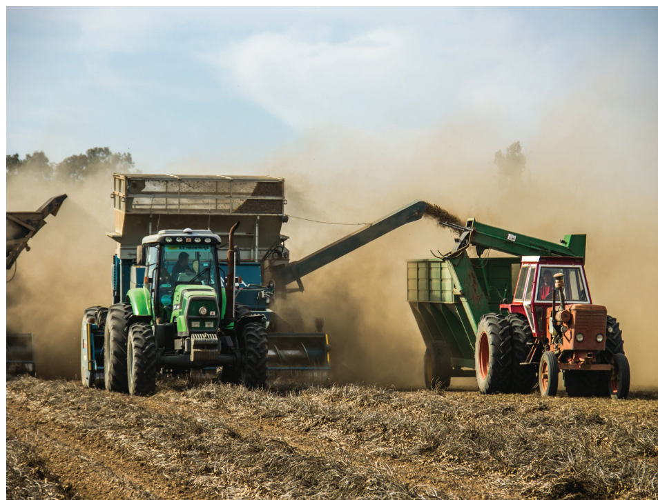
Despodadora de doble hilera

El secado natural en el campo se realiza cuando las condiciones climáticas lo permiten. Para ello se requieren días con temperaturas elevadas, baja humedad relativa, vientos suaves y al menos una semana sin lluvias. Evidentemente que estas condiciones se dan sólo en determinadas épocas