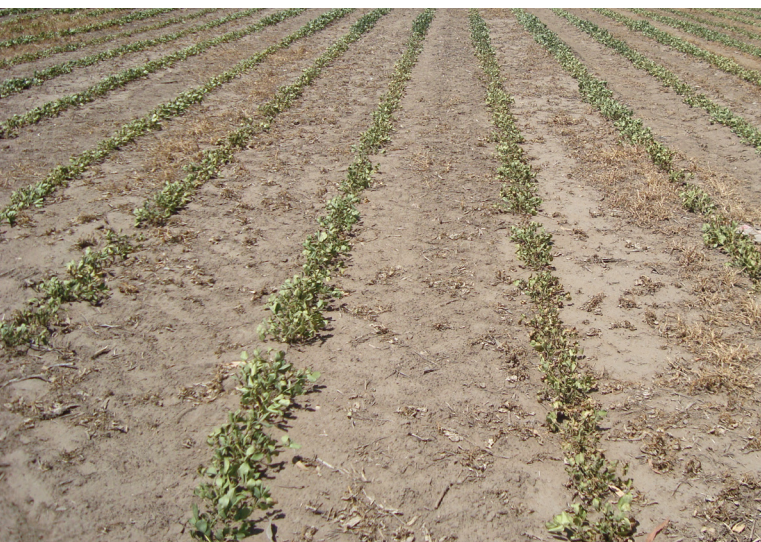
Sequía en primera etapa de crecimiento del maní

En el período de madurez del cultivo hasta cosecha las exigencias de agua son menores.