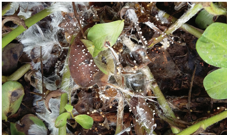
Muerte de plantas por complejo de hongos del suelo

castaña hasta que se produce la muerte de las plantas. Los daños causados por esta enfermedad se acentúan a medida que avanza el otoño manifestándose con mayor intensidad cuando las plantas se encuentran en el período de llenado de vainas (fines de febrero en adelante), produciendo la destrucción parcial o total de vainas y granos.