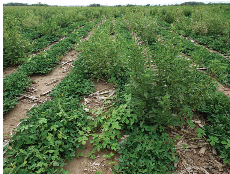
Lote de maní enmalezado