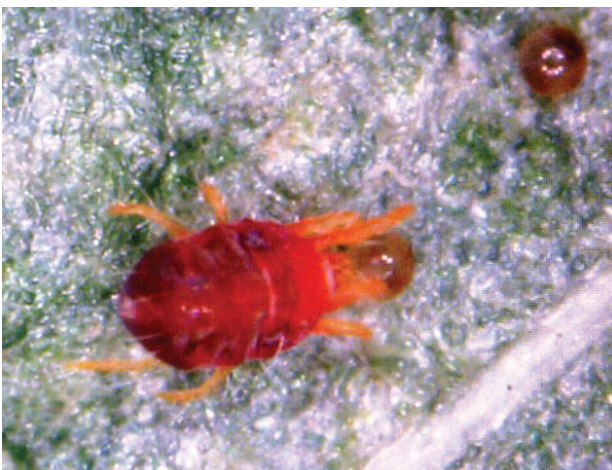
Arañuela adulta y huevos

Las arañuelas ( Tetranychus sp.) producen daños a la planta al succionar el contenido de las células desde el envés de las hojas. La presencia de arañuelas se observa en manchones dentro del lote, especialmente a lo largo de las cabeceras, mostrando las plantas un aspecto amarillento grisáceo. Cuando el ataque es intenso las plantas mueren. poblaciones se incrementan rápidamente y pueden pasar, en pocos días, de difícilmente observables a presencia abundante.