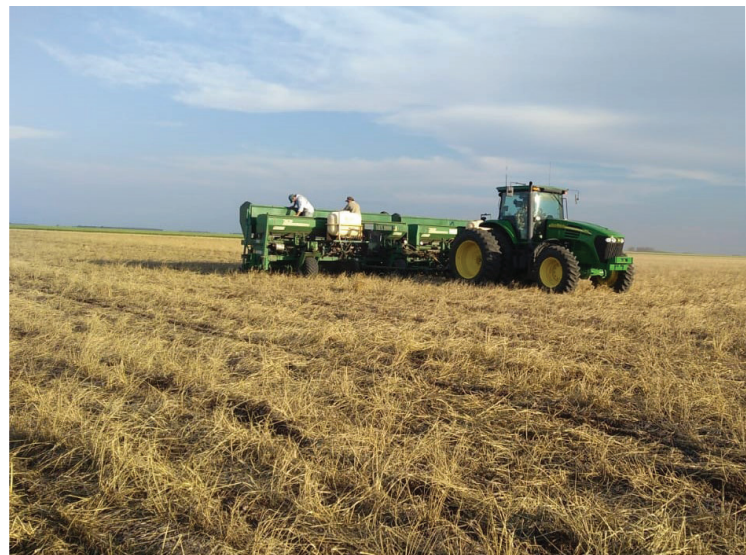
Siembra sobre cultivo de cobertura

crecimiento inicial de las plantas. La presencia de semillas de otros cultivares perjudica tanto el manejo agronómico como el valor comercial del producto cosechado.