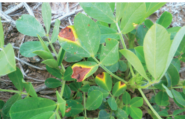
Hoja con síntoma de mancha en V

arachidicola. Los síntomas se presentan como parches difusos de color castaño con márgenes grisáceos. La forma en red de las manchas es característica en la cara superior de las hojas. Se la puede observar durante el otoño en períodos que predominan baja temperatura y elevada humedad relativa.