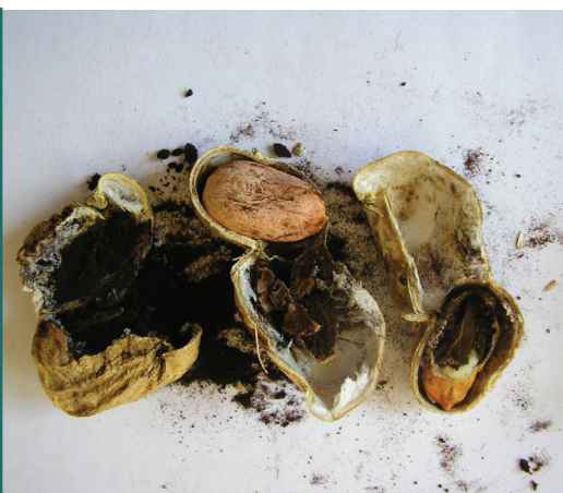
Síntomas de Carbón en maní

EL CONTROL MÁS EFICIENTE DE LAS ENFERMEDADES DEL SUELO ES LA PREVENCIÓN