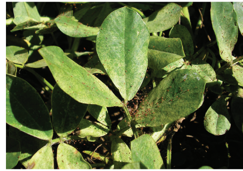
Arañuela sobre el cultivo

Los ataques más severos se producen en años cálidos y secos, cuando las arañuelas pueden completar una generación en 10-12 días, por lo que las