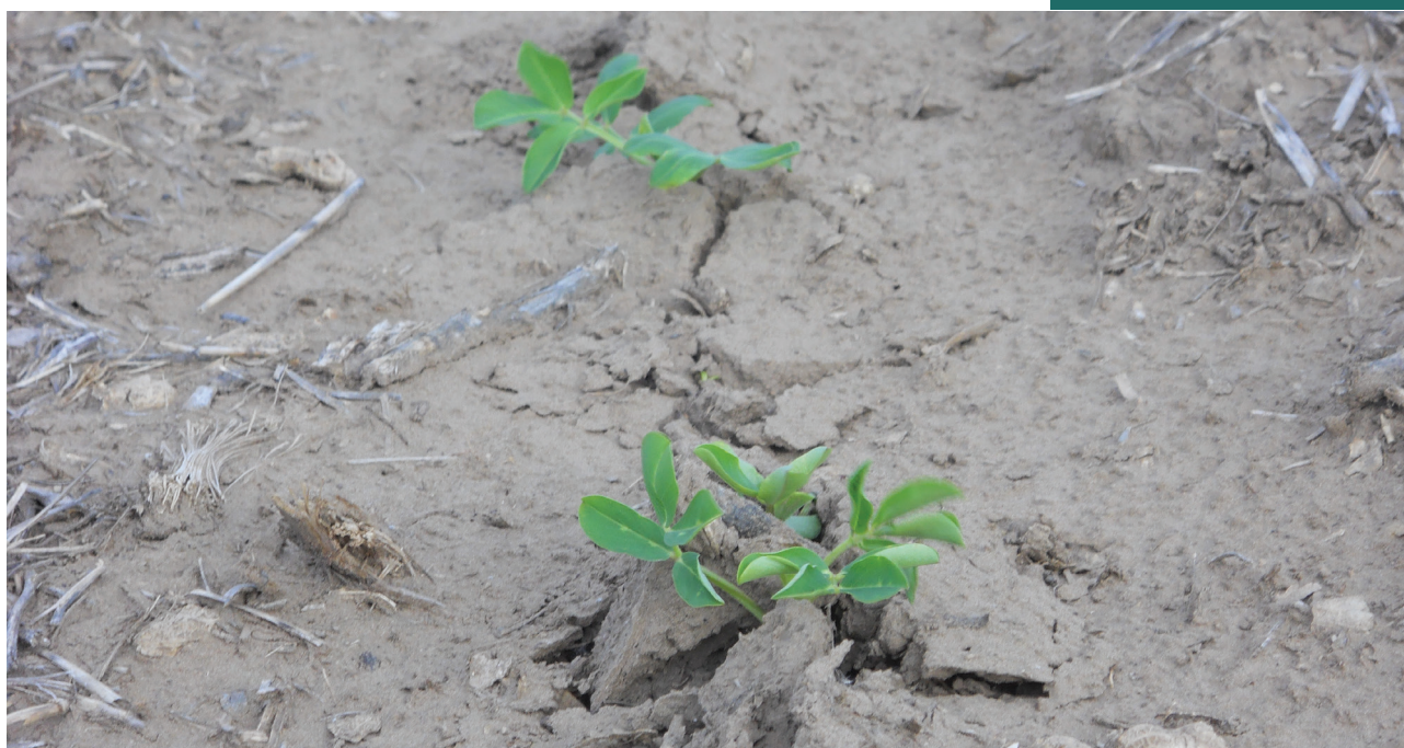
Nacimiento de maní en suelo encostrado

EN LA ROTACIÓN DE CULTIVOS, EL MANÍ DEBE INCLUIRSE CADA CUATRO AÑOS O MÁS.