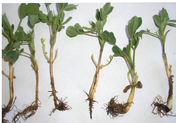
Plántulas con daños en raíces por hongos del suelo

Como consecuencia de la acción de estos organismos a nivel de raíz y cuello donde se inicia la infección, se observa en la parte aérea un marchitamiento total o parcial de las ramas, las que van adquiriendo una coloración