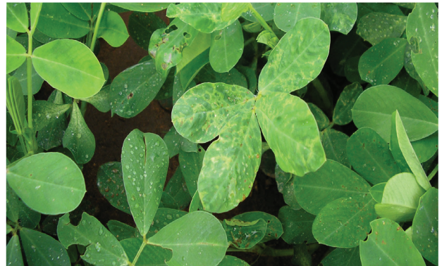
Hojas afectadas por trips

Las especies de trips encontradas con mayor frecuencia en la Provincia de Córdoba son Frankliniella schultzei y Caliothrips phaseoli . Son pequeños insectos que se alimentan de las flores y hojas en desarrollo a través de un "raspado" de la capa superior de la epidermis y succión del contenido celular. Además del daño producido en la hoja son transmisores de enfermedades. En general, no son un problema en cultivos de maní en Córdoba, pero en determinados años, con temperaturas bajas, sequías o daños