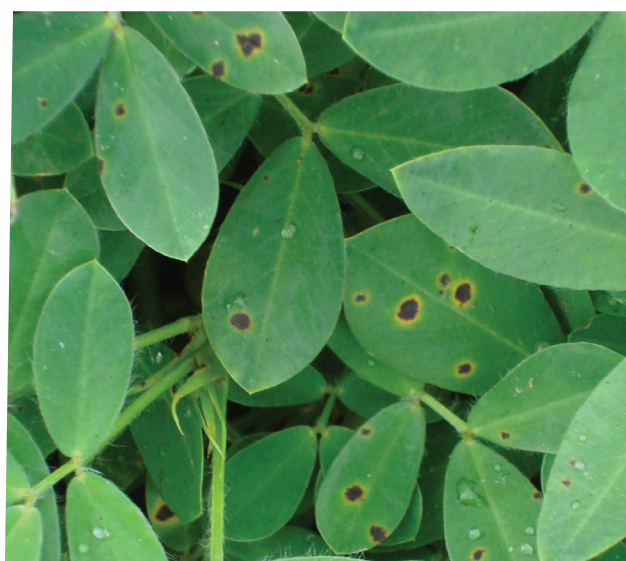
Intenso ataque de viruela tardía

La viruela temprana y la viruela tardía pueden ser identificadas por producir pequeñas manchas de color marrón, de un tamaño que oscila entre 2 a 4 mm de diámetro. La viruela temprana tiene generalmente un halo amarillento alrededor de la mancha, el cual también puede estar presente en la