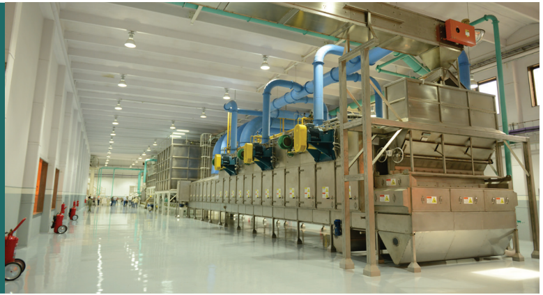
Sala de blandeado

EL MANÍ DEBE SER ALMACENADO EN VAINAS CON UNA HUMEDAD INFERIOR AL 10%